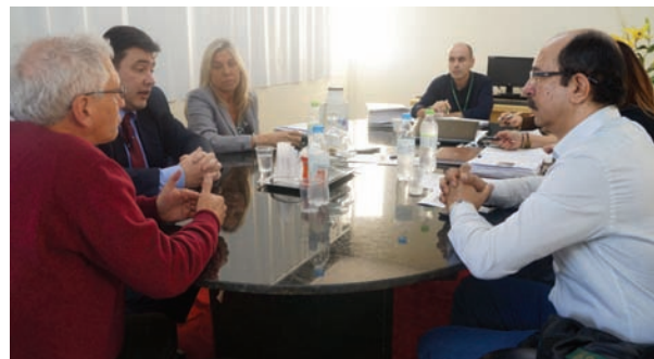
Representantes da operadora CASSI foram convidados pela CEHMRS