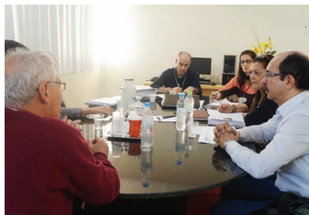
O objetivo dos encontros com as operadoras é melhorar o relacionamento dentre os médicos credenciados e as empresas.