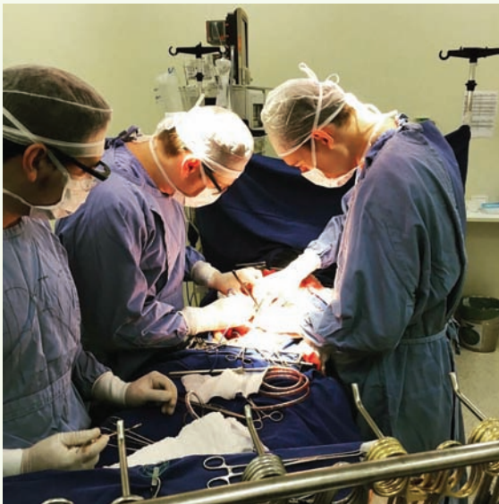
..... Comissão de Doação de Órgãos atua de forma contínua contra tabus