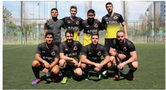
..... FURG: time vencedor da Copa Bixo DU

Ao final, os participantes comemoraram com um belo churrasco. Além do campeonato de futebol, cada inscrito participou da ação solidária levando 1 kg de alimento não perecível. O destino dos doativos é o Instituto Vida Solidária. Através de uma parceria com o Planet Ball, onde foi realizada a competição, houve ainda a arrecadação de um saldo extra de R$ 100,00 para compra de mais alimentos.