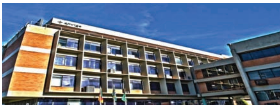
..... Fachada do prédio da AMRIGS