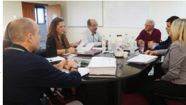
Comissão se reuniu com as operadoras na sede da AMRIGS