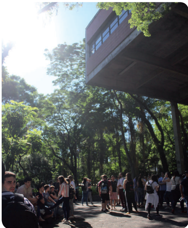
Estudantes chegam até a PUCRS, um dos locais de aplicação da prova em Porto Alegre