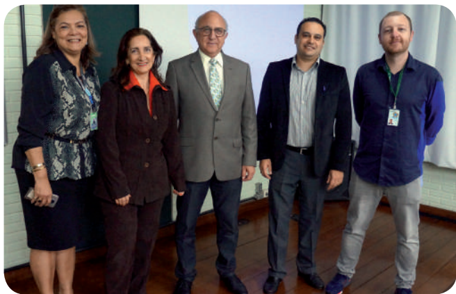
Evento debateu cenário da saúde suplementar

A Comissão Estadual de Honorários Médicos do Rio Grande do Sul (CEHM-RS) se reuniu com representantes das Sociedades de Especialidades, na sede da Associação Médica do Rio Grande do Sul (AMRIGS), para apresentar o cenário atual do sistema de saúde suplementar e organizar as demandas das especialidades médicas.