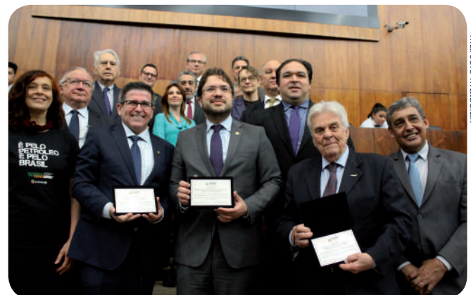
Líderes das entidades e parlamentares