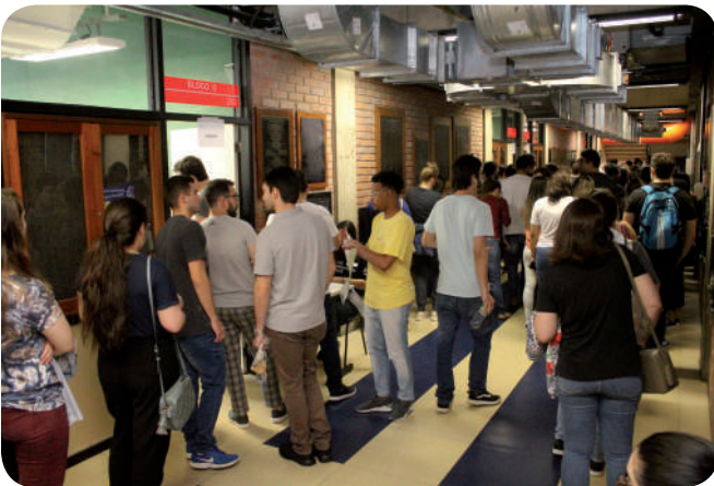
Prova AMRIGS cresce a cada ano

Mato Grosso do Sul foi o estado que registrou o maior aumento no número de inscritos com um crescimento de 115%.