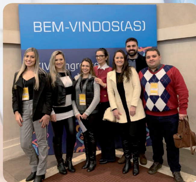
XIV Congresso Gaúcho de Psiquiatria

debates, reunindo todas as especialidades e preceptores. Também são realizados rounds diários para cada especialidade e há um grande incentivo da nossa Comissão de Residência Médica para participação do Residente em eventos e congressos.