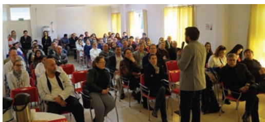
Caravana no município de Tenente Portela

A associação médica dos gaúchos, reforçando as ações públicas de prevenção e combate ao mosquito transmissor da Dengue, Febre Chikungunya e Zika Vírus, promoveu, entre os dias 27 e 30 de abril, a Caravana AMRIGS contra o Aedes aegypti. Além do Aedes, as caravanas, que visitaram oito cidades da Região Noroeste do Estado, debateram temas como a gripe A H1N1 e a responsabilidade civil, criminal e ética do médico. As atividades tiveram o objetivo de reforçar as campanhas de combate ao mosquito Aedes aegypti naquela região e de conscientizar as comunidades sobre a importância dos cuidados preventivos para o controle das doenças causadas pelo inseto.